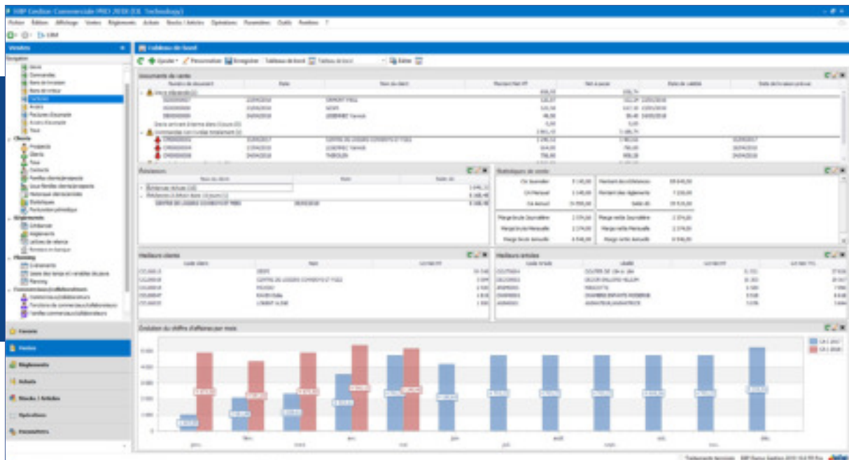
Visualisez en un coup d'œil vos indicateurs : commandes à livrer, factures non réglées, évolution du chiffre d'affaires, etc.